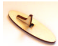
Ständer CLSH 4705

Zunächst wird die Schildertafel Herz (HEH16220), der Ständer für das Herz (CLSH4705), sowie der Geldscheinhalter (DAH0903-1) mit Acrylfarbe beidseitig grundiert.